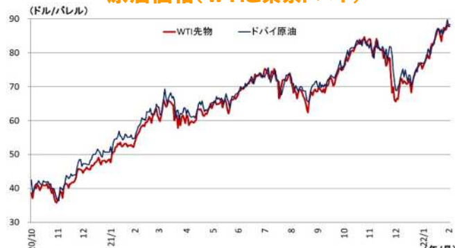
原油価格(WTIと東京ドバイ)

(注) WTI 先物は期近物。ドバイは東京原油スポット市場中東産ドバイ原油、翌月または翌々月渡し、現物、FOB、中心値 (資料) Financial Times、日本経済新聞